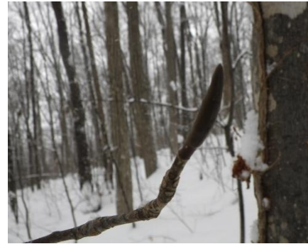
ホオノキの冬芽 (朴の木) モクレン科

葉が落ちた森の中で冬芽と合わせて観察しやすいです。プロペラの役割で遠くに種子を運び、次世代につなげます。