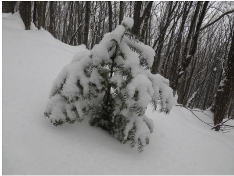
トドマツの幼木 (緞松) マツ科

森の中を歩いていると大木から幼木まで様々な木を見かけます。果たしてこれは何年目のトドマツでしょうか？