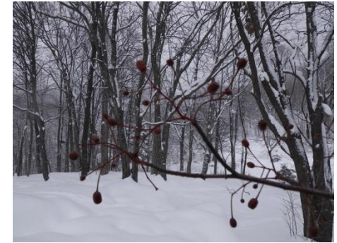
ナナカマドの果実 (七竈) バラ科

ナイフのように見える大きい冬芽にはホオノキの葉が詰まっています。冬芽の根元には昨年の葉の痕が見えます。