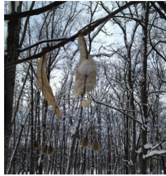
シナノキの果実 (科の木) シナノキ科

森の中を歩いていると大木から幼木まで様々な木を見かけます。果たしてこれは何年目のトドマツでしょうか？